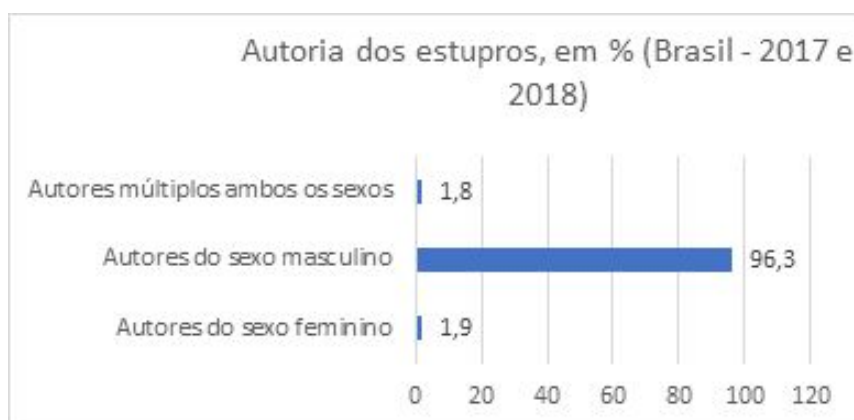
Gráfico 4 - Autoria dos estupros, em %