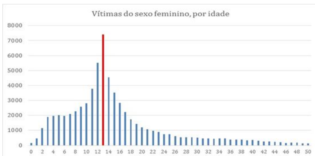
Gráfico 3 - Vítimas do sexo feminino, por idade